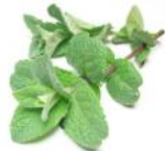
MENTHE POIVRÉE (vivace)

EST UTILISÉE DANS UN GRAND NOMBRE DE PLATS: TERRINES VIANDES GLACES ETC. ON PEUT AUSSI EN FAIRE DES TISANES OU DU THÉ. VIVACE VIGOREUSE TRÈS FACILE À CULTIVER.