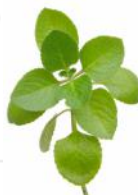
OREGANO GREC (vivace)

VIVACE. SERT À ÉPICER, ENTRE AUTRES, LES PIZZAS, SOUS-MARINS, SAUCES TOMATES ET PLATS MEXICAINS. FACILE À CULTIVER.