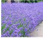
LAVANDE MUNSTEAD (vivace)

CULTIVÉE POUR SES TIGES ET FLEURS PARFUMÉES. UTILISÉES SÉCHÉES EN SACHET, POT-POURRI ETC. PLANTÉE AU POTAGER CHASSERA LES PUCERONS. EN INFUSION POUR CHASSER LES MAUX DE TÊTE.