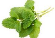
MELISSE OFFICINALIS (vivace)

COUSIN DE LA MENTHE PRODUISANT DE DÉLICATES FEUILLES DENTELEES QUI DÉGAGENT UNE ODEUR DE CITRON. LES FEUILLES INFUSÉES DONNENT UNE AGRÉABLE TISANE RELAXANTE, QUE L'ON PEUT AGRÉMENTER DE MIEL.