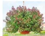
OREGANO ZORBA RED (vivace)

TRÈS DÉCORATIVE CETTE FINE HERBE SE CULTIVE EN CONTENANT, JARDINIÈRE OU BALCONIÈRE. SES INFLORESCENCES ROUGES ET BLANCHES CONTRASTENT AVEC SON FEUILLAGE VERT FONCÉ. COMME L'ORÉGANO SES FEUILLES ET SES FLEURS SONT UTILISÉES EN CUISINE.