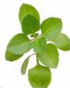
OREGANO GREC (vivace)

VIVACE. SERT À ÉPICER, ENTRE AUTRES, LES PIZZAS, SOUS-MARINS, SAUCES TOMATES ET PLATS MEXICAINS. FACILE À CULTIVER.