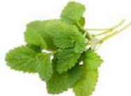
MELISSE OFFICINALIS (vivace)

COUSIN DE LA MENTHE PRODUISANT DE DÉLICATES FEUILLES DENTELÉES QUI DÉGAGENT UNE ODEUR DE CITRON. LES FEUILLES INFUSÉES DONNENT UNE AGRÉABLE TISANE RELAXANTE, QUE L'ON PEUT AGRÉMENTER DE MIEL.