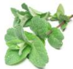
MENTHE POIVRÉE (vivace)

EST UTILISÉE DANS UN GRAND NOMBRE DE PLATS: TERRINES VIANDES GLACÉS ETC. ON PEUT AUSSI EN FAIRE DES TISANES OU DU THÉ. VIVACE VIGOUREUSE TRÈS FACILE À CULTIVER.